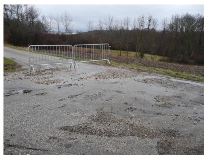
Ravinement et apport de matériaux au niveau de la voirie