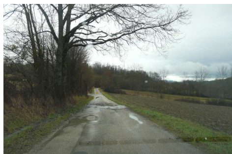
Débordement du Toison en fond de vallée et surverse au niveau de la voirie